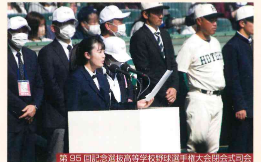
第95回記念選抜高等学校野球選手権大会閉会式司会